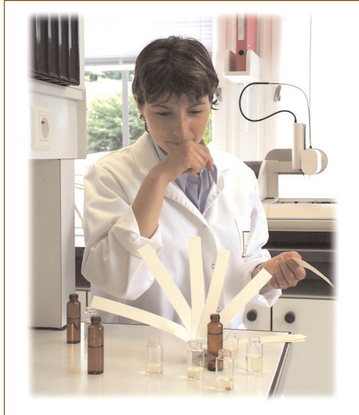
Le nez du parfum