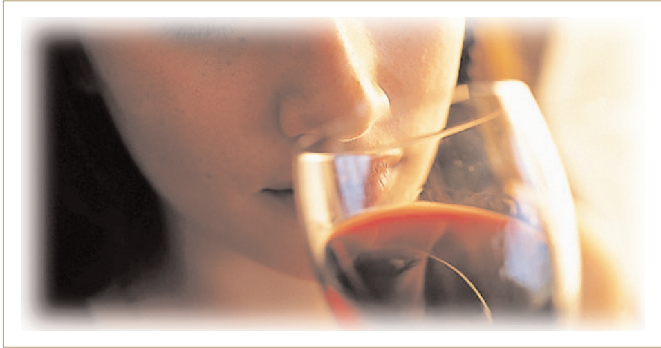
Le nez du vin